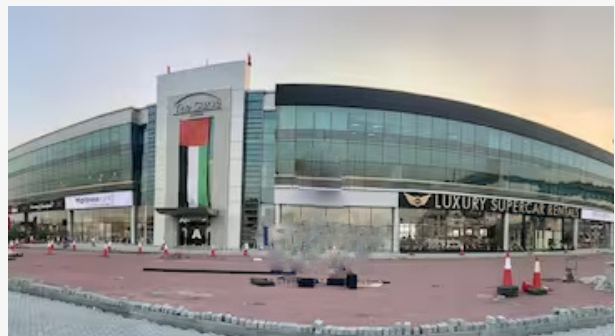
THE CURVE BUILDING - SZR