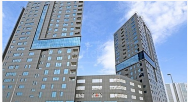
CAPITAL BAY - BUSINESS BAY