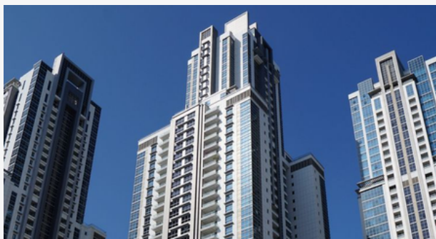
EXECUTIVE TOWER - BUSINESS BAY