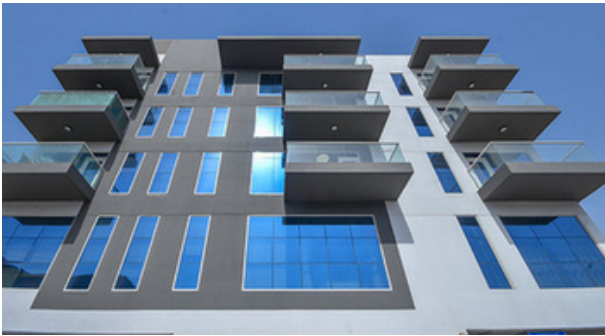
AL ZAROUNI RESIDENCE - MIRDIF