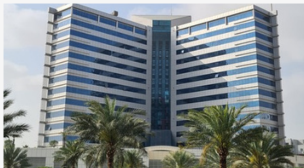
IT PLAZA - SILICON OASIS