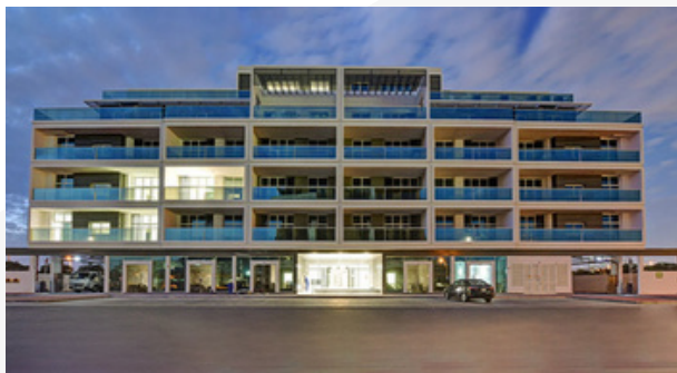
GODOLPHIN AVENUE - MEYDAN

За два десятилетия мы создали более 3400 жилых и 1500 коммерческих помещений с исключительным вниманием к деталям. Мы заботимся о том, чтобы обеспечить вам комфортный и спокойный образ жизни, предлагая жилую, коммерческую недвижимость и недвижимость для отдыха в Дубае.