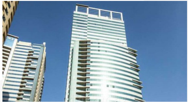
1 LAKE PLAZA - JLT