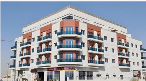
AL ZAROONI - WARSAN