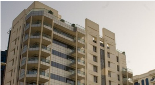
AL BAYAN - AL RAFFA